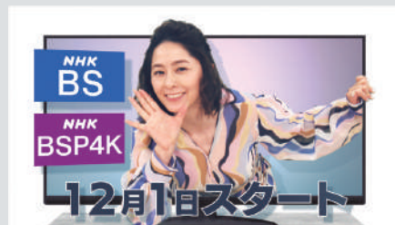
NHKアナウンサー 杉浦友紀

2023年12月に番組改定を行い、「NHK BS」と「NHK BS プレミアム4K」がスタートします。 新しい衛星2波は、2K・4Kそれぞれの特性を生かしたコンテンツを柔軟に編成し、地上波では味わえない新たな価値を創造します。